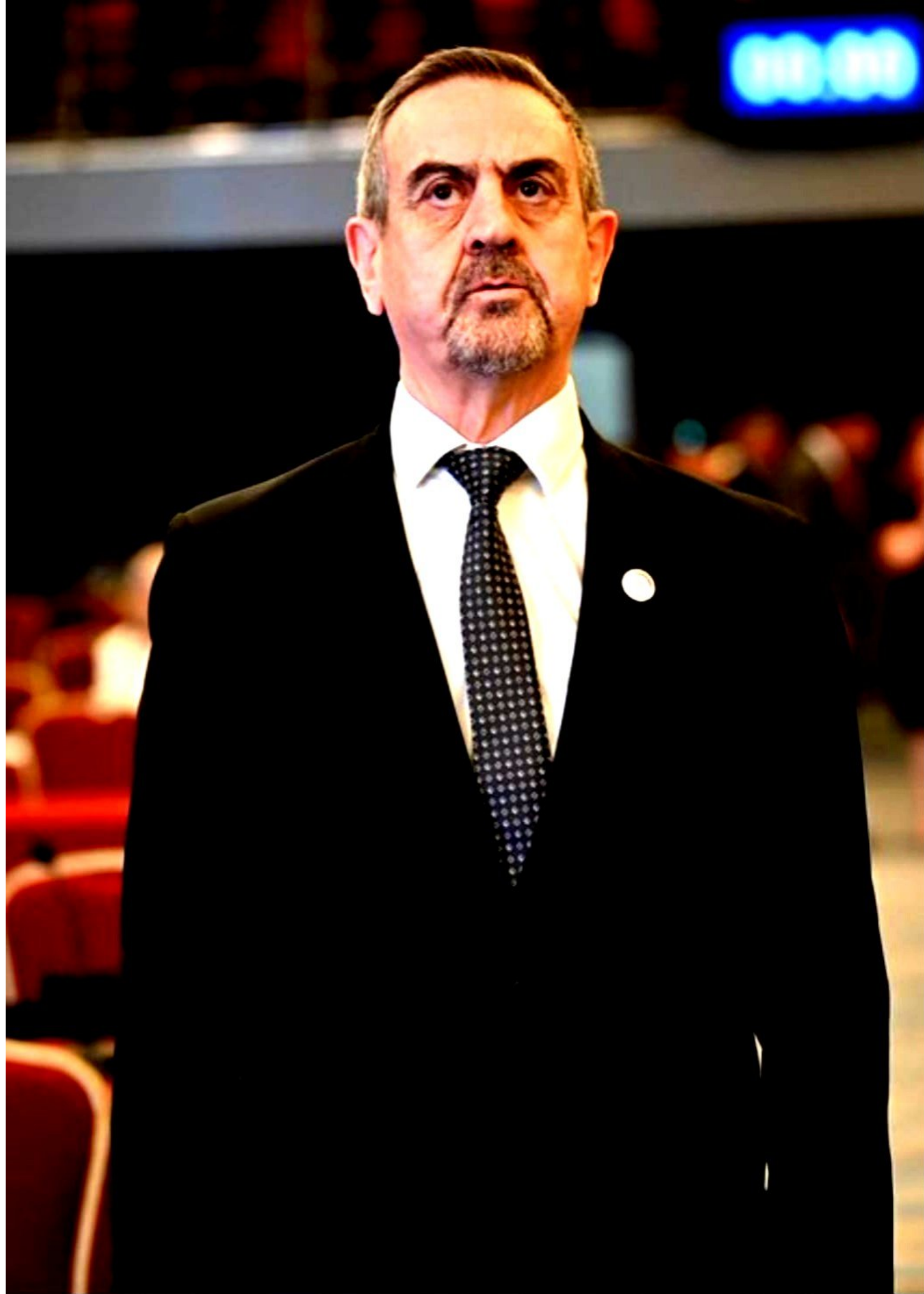
Parlamentario Yamil Esgaib (Paraguay)